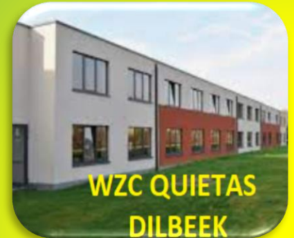
WZC QUIETAS DILBEEK